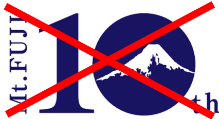
ロゴマークのみによる使用