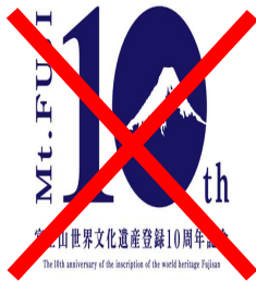
比率の変更による使用